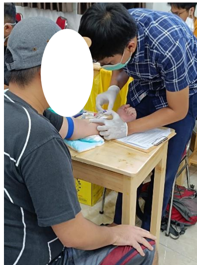
Gambar 1. Pengambilan Darah

Kegiatan pengabdian kepada masyarakat ini dilaksanakan di lingkungan Gereja Baptist Cengkareng dengan melibatkan populasi dewasa (usia \geq 18 tahun) yang bersedia mengikuti program edukasi kesehatan dan pemeriksaan fungsi ginjal. Metode kegiatan dirancang sebagai intervensi promotif dan preventif berbasis komunitas dengan fokus utama pada estimasi laju filtrasi glomerulus (eGFR) sebagai indikator kunci deteksi dini penyakit ginjal kronik (PGK). Pendekatan ini mengacu pada algoritma terkini deteksi dan klasifikasi PGK yang direkomendasikan oleh Kidney Disease: Improving Global Outcomes (KDIGO), yang menempatkan eGFR sebagai parameter fundamental dalam penilaian risiko dan stratifikasi stadium penyakit ginjal. Pelaksanaan kegiatan disusun secara terstruktur dengan menerapkan siklus Plan-Do-Check-Act (PDCA) guna menjamin kesinambungan antara tahap perencanaan, implementasi, evaluasi, dan tindak lanjut program kesehatan masyarakat. (Gambar 1)