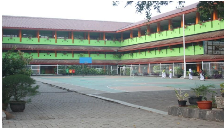
Gambar 3. Lingkungan SMK Negeri 48 Jakarta

Kegiatan sosialisasi ini diikuti oleh 60 siswa/i dan didampingi oleh Ibu Wahyu selaku wakil kepala sekolah yang turut mendukung pelaksanaan kegiatan. Kegiatan diawali dengan pembukaan dan perkenalan dari tim pelaksana kepada peserta, kemudian dilanjutkan dengan sesi ice breaking guna menciptakan suasana yang lebih interaktif dan meningkatkan antusiasme siswa sebelum materi disampaikan. Setelah sesi ice breaking, tim pelaksana menyampaikan materi mengenai pengertian korupsi, jenis dan contoh perilaku koruptif, dampak korupsi, serta pentingnya penerapan nilai integritas dan kejujuran dalam kehidupan sehari-hari. Materi yang disampaikan mencakup pengenalan definisi korupsi sebagai penyalahgunaan kekuasaan atau jabatan yang merugikan masyarakat dan negara. Selain itu, peserta diberikan pemahaman mengenai berbagai jenis korupsi, seperti suap, penggelapan, nepotisme, dan pemerasan beserta contoh-contohnya dalam kehidupan nyata. Untuk meningkatkan relevansi materi dengan kehidupan peserta, pemateri juga menjelaskan berbagai bentuk perilaku koruptif yang dapat ditemui dalam lingkungan pelajar, seperti menyontek saat ujian, titip absen, manipulasi uang kas, mengambil barang teman tanpa izin, serta ketidakjujuran dalam meminta uang kepada orang tua. Melalui contoh-contoh tersebut, siswa diajak memahami bahwa perilaku koruptif tidak selalu terjadi dalam skala besar, tetapi dapat bermula dari tindakan kecil yang bertentangan dengan nilai integritas dan kejujuran.