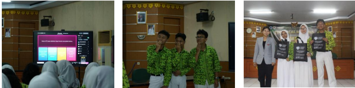
Gambar 5. Pelaksanaan Kuis dan Permainan Edukatif

Kegiatan kuis dan permainan edukatif yang digunakan untuk memperkuat pemahaman peserta terhadap materi antikorupsi ditunjukkan pada Gambar 5.