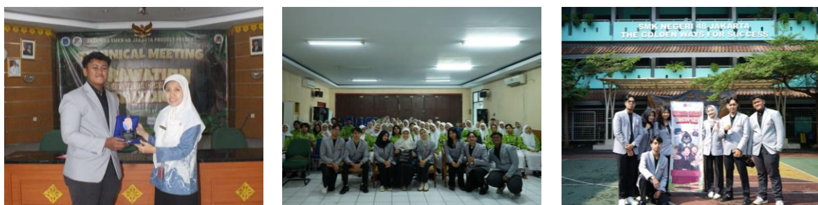
Gambar 6. Penyerahan Plakat dan Foto Bersama

Sebagai bentuk apresiasi dan ucapan terima kasih kepada pihak sekolah yang telah mendukung serta memfasilitasi pelaksanaan kegiatan sosialisasi anti korupsi, tim pelaksana memberikan plakat kepada perwakilan sekolah. Penyerahan plakat tersebut menjadi simbol kerjasama dan dukungan yang baik antara pihak sekolah dan tim pelaksana dalam menyelenggarakan kegiatan edukasi bagi siswa/i. Selain itu, pemberian plakat juga diharapkan dapat mempererat hubungan kerja sama antara institusi pendidikan dan pihak kampus dalam mendukung kegiatan pengabdian kepada masyarakat yang bermanfaat bagi siswa. Setelah seluruh rangkaian kegiatan selesai dilaksanakan, acara kemudian ditutup dengan sesi foto bersama antara tim pelaksana, peserta, serta pihak sekolah sebagai bentuk dokumentasi kegiatan pengabdian kepada masyarakat yang telah berlangsung dengan lancar dan penuh antusiasme dari para peserta. Sesi foto bersama juga menjadi momen penutup kegiatan yang menunjukkan adanya partisipasi aktif serta dukungan dari seluruh pihak yang terlibat dalam pelaksanaan sosialisasi anti korupsi di lingkungan sekolah. Dokumentasi penyerahan plakat kepada pihak sekolah serta sesi foto bersama peserta dan tim pelaksana dapat dilihat pada Gambar 6.