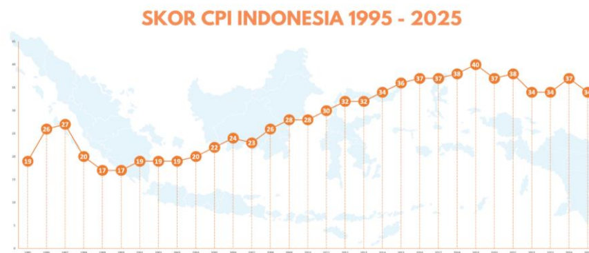
Gambar 1. Perkembangan Corruption Perceptions Index (CPI) Indonesia Tahun 1995-2025