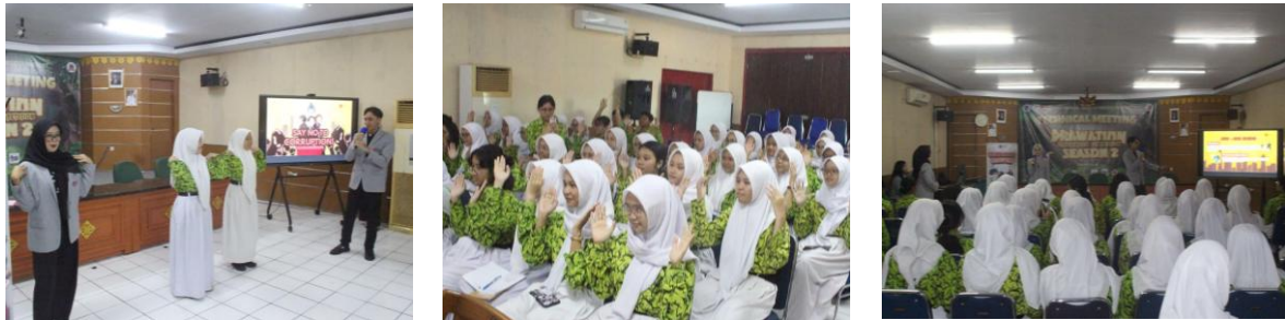
Gambar 4. Pelaksanaan Ice Breaking dan Penyampaian Materi Sosialisasi Anti Korupsi

Lebih lanjut, peserta menunjukkan respons positif terhadap materi yang disampaikan. Berdasarkan hasil observasi selama sesi diskusi dan tanya jawab, sebagian besar siswa mampu mengaitkan materi antikorupsi dengan perilaku sehari-hari di lingkungan sekolah, seperti menghindari menyontek, tidak melakukan titip absen, serta bersikap jujur dalam menyelesaikan tugas. Beberapa peserta juga menyampaikan bahwa materi yang diberikan membantu mereka memahami bahwa perilaku koruptif tidak hanya terjadi dalam lingkup pemerintahan, tetapi juga dapat muncul dari tindakan sederhana yang bertentangan dengan nilai kejujuran dan tanggung jawab.