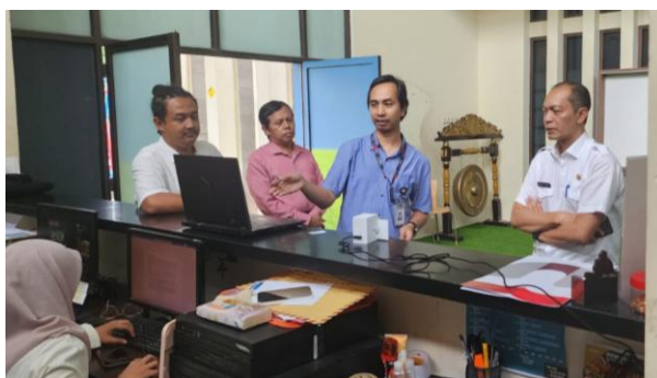
Gambar 1. Survei dan Analisis Kebutuhan

Berdasarkan observasi di Gedung Science Center, ditemukan bahwa ketergantungan pada sistem pencatatan manual menciptakan celah inefisiensi yang besar, terutama saat menghadapi lonjakan pengunjung kolektif. Secara kritis, kondisi ini menunjukkan adanya hambatan dalam transparansi data yang sering terjadi pada manajemen aset publik konvensional. Transformasi digital di area publik bukan sekadar tren, melainkan kebutuhan mendesak untuk merespons dinamika industri 4.0 yang menuntut kecepatan dan ketepatan data (Adisaputra & Setiaji, 2025). Melalui identifikasi parameter data yang mendalam, tim berhasil merumuskan arsitektur sistem yang mampu menangkap variabel demografi pengunjung secara otomatis, yang merupakan aset penting dalam analisis big data untuk keperluan strategi pemasaran destinasi wisata di masa depan (Yanti, 2020). Dokumentasi survei dan analisis kebutuhan dapat dilihat pada Gambar 1.