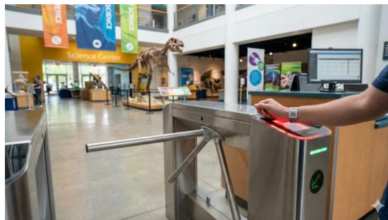
Gambar 2. Gerbang Interaktif QR Code

dipilih secara strategis karena efisiensi biayanya dan kemudahan adopsi oleh masyarakat luas dibandingkan teknologi RFID atau biometrik yang lebih mahal. Secara teknis, sinkronisasi antara pemindaian tiket dan pergerakan motor pada gerbang dilakukan dengan latensi rendah untuk menjamin kelancaran arus pengunjung. Analisis kritis terhadap penggunaan QR Code menunjukkan bahwa meskipun teknologinya sederhana, tingkat keamanan enkripsi yang diterapkan mampu meminimalisir risiko penggandaan tiket ilegal, sejalan dengan salah satu penelitian mengenai sistem tiket berbasis kode respons cepat (Kuncara et al., 2021). Difusi teknologi ini secara langsung mengubah interaksi fisik di pintu masuk menjadi proses digital yang terukur, dimana merupakan pilar utama dalam pengembangan ekosistem smart ticketing di destinasi wisata lokal (Keyuraphan et al., 2023). Hasil perangkat keras dapat dilihat pada Gambar 2.