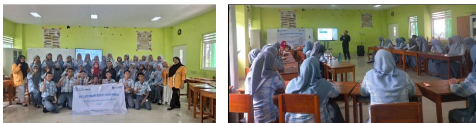
Gambar 3. Dokumentasi kegiatan pelatihan

Selanjutnya, penelitian yang dilakukan oleh Alfikar, Zubair, & Gismin (2022) juga mendukung hasil yang diperoleh. Hal ini dikarenakan, hasil analisis yang dilakukan kepada seluruh mahasiswa demonstran di Kota Makassar diperoleh hasil bahwa kontrol diri yang dihubungkan dengan kematangan emosi tidak berpengaruh signifikan terhadap agresivitas mahasiswa. Dengan demikian self control yang dimiliki oleh mahasiswa akan berpengaruh terhadap lingkungan sekitarnya sehingga hal ini kemudian mempengaruhi adanya faktor lain yang memicu individu melakukan perilaku agresif.