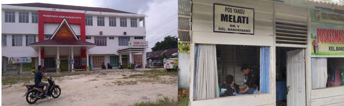
Gambar 1. Kantor Puskesmas Bangkinang Kota

dijalankan, yakni penimbangan balita yang dilakukan tiap bulan di posyandu dengan tujuan untuk pemantauan pertumbuhan dan mendeteksi sedini mungkin penyimpangan pertumbuhan balita. Imunisasi bagi para balita dengan ketentuan dan jenis imunisasi tertentu. Peningkatan gizi baik dengan penyuluhan dan/atau memberikan bagi bayi dan ibu yang membutuhkan. Penanggulangan penyakit bagi ibu dan bayi seperti diare pada balita(Listiyono dkk.,2022).